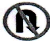
"ইউ" টার্ন নিষেধ