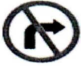
ডানে মোড় নিষেধ