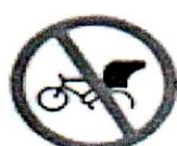
রিক্সা চলাচল নিষেধ