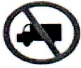
ট্রাক চলাচল নিষেধ