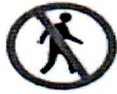
পথচারী চলাচল নিষেধ