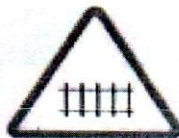
কমিক বেল ওয়ে এনিসং