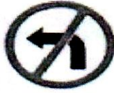
বামে মোড় নিষেধ