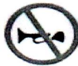
হর্ন বাজানো নিষেধ